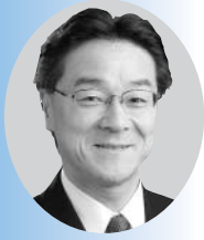
本田 光広 氏

エコール・ポリテクニク（フランス）、ボンゼンセ工科大学（フランス）卒業、MBA取得（国際ビジネス）。1991年フランス設備省入省。1992～1993年、フランス設備省より日本の建設省（現・国土交通省）へ出向（東京・新潟）。欧州委員会・産業政策局や貿易総局（ブリュッセル）などを経て、2008年より現職。駐日欧州委員会代表部・参事官を兼務。日本語およびフランス語、英語、ドイツ語、スペイン語、イタリア語などのヨーロッパ言語に堪能。著書に「Nipponite」(Les Editions d'Organisation, 1994)がある。